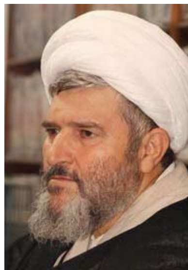
تحقق یک ارزوی بزرگ

انقلاب اسلامی ایران با بهره‌گیری از آموزه‌های قرآنی و تعالیم نبوی، نمونه کاملی از حیات طیبه را به مردم جهان عرضه کرد و پس از گذراندن فراز و نشیب‌های بسیار، الگویی برای مسلمانان و آزاداندیشان جهان گردیده است. آنچه در پی می‌خوانید نوشتاری از حجت الاسلام و المسلمین علی آل کاظمی، محقق و پژوهشگر حوزوی پیرامون جایگاه نهضت بزرگ ملت ایران از دیدگاه آیات و روایات است.